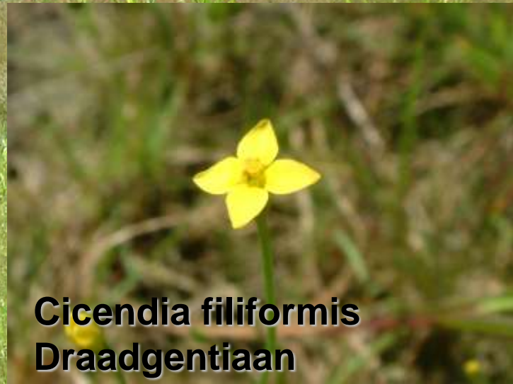
Cicendia filiformis Draadgentiaan