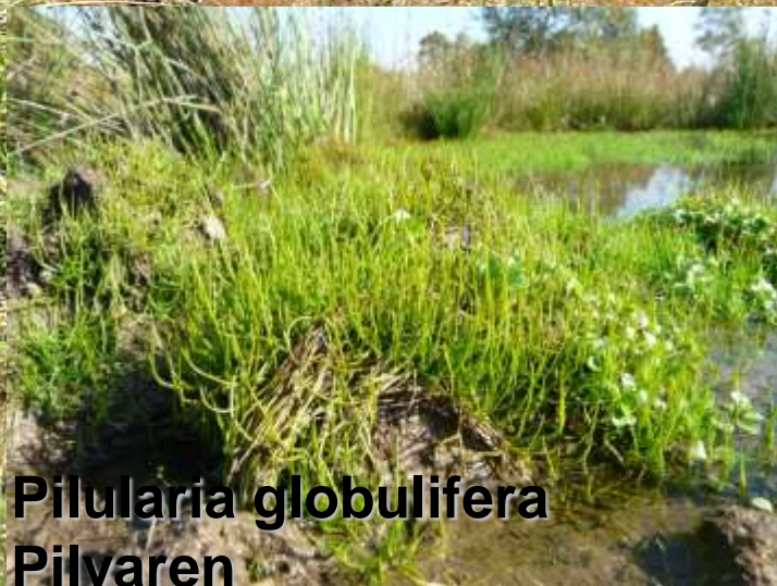
Pilularia globulifera Pilvaren