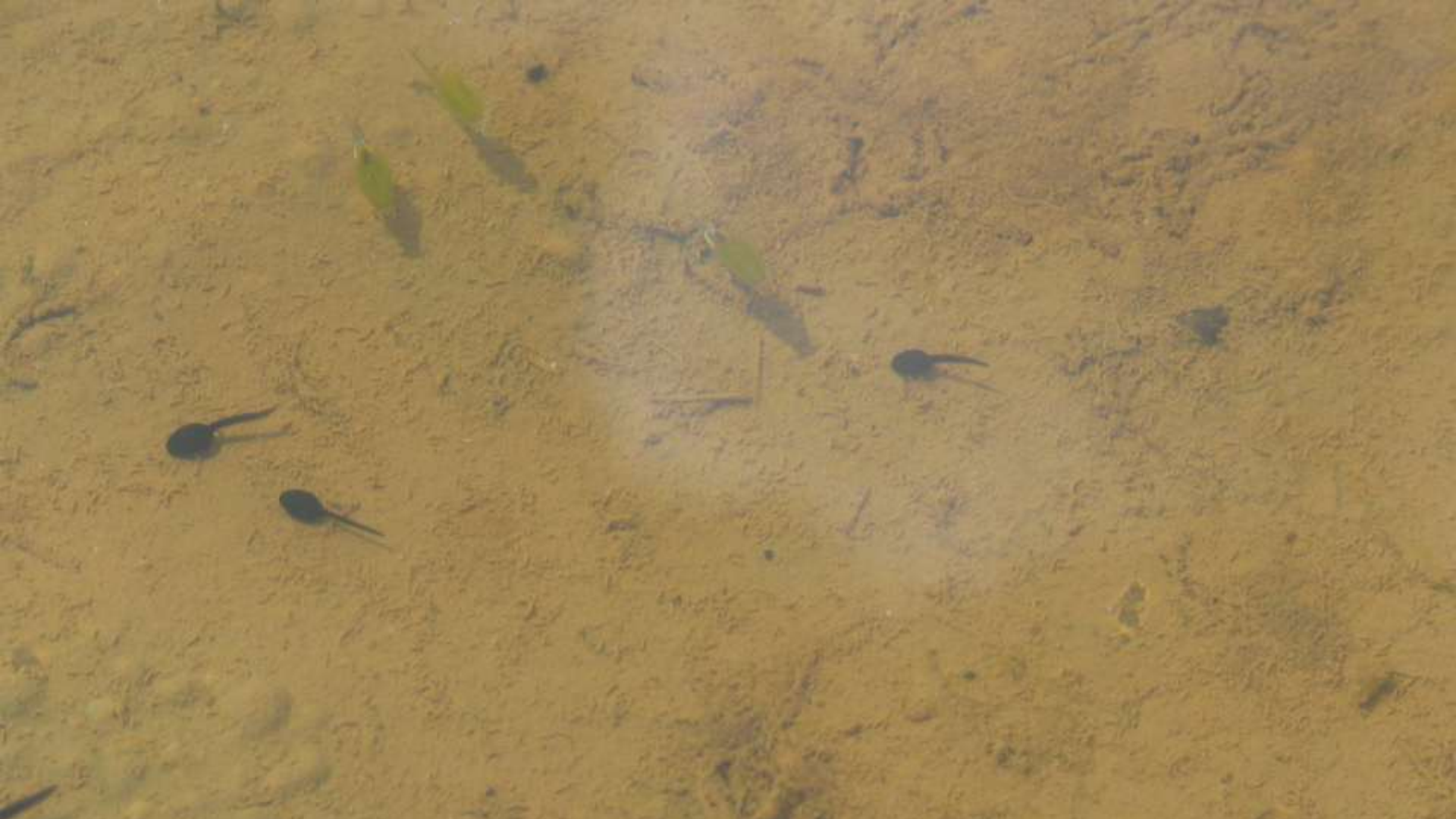
Bufo calamita Rugstreppad Branchipus schaefferi