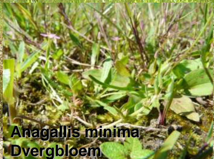
Anagallis minima Dvergbloem