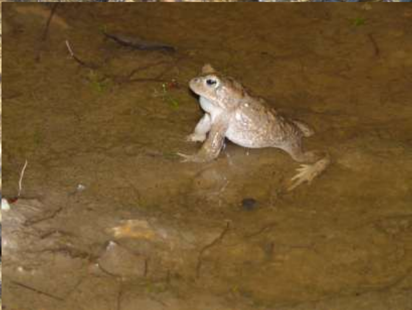
Bufo calamita Rugstreeppad