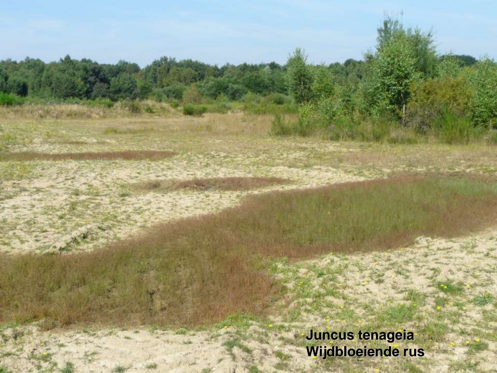
Juncus tenageia Wijdbloeiende rus