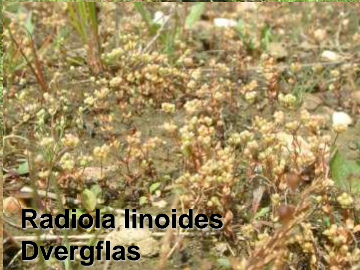
Radiola linoides Dvergfla