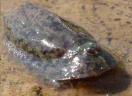
Triops cancriformis Leem-kieuwpootkreeft